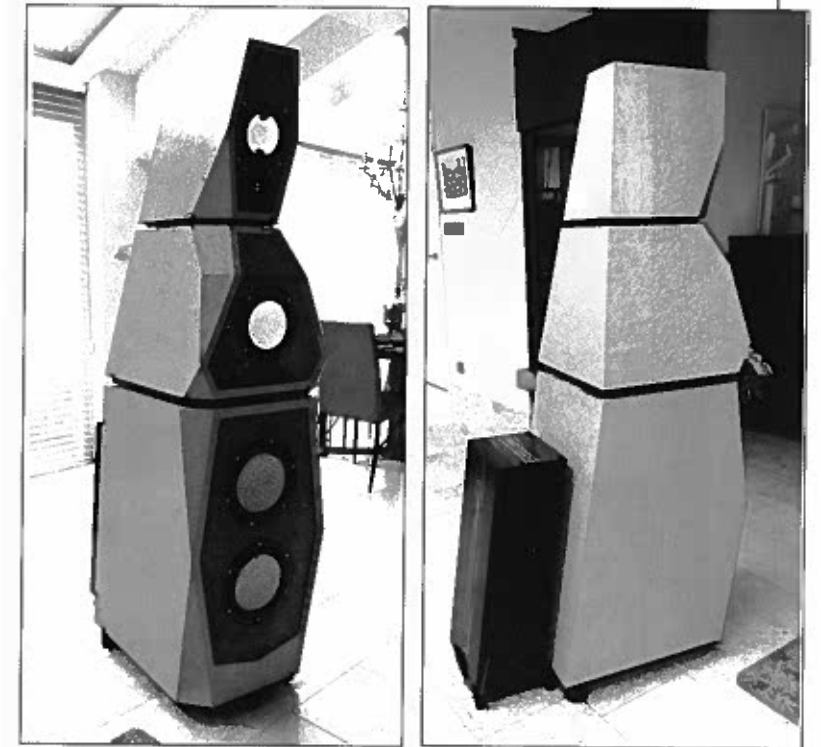
L'enceinte, avec ses caches retirés. Chaque enceinte pèse 250 kg. Elle se compose de 3 modules superposés. La vue arrière de l'enceinte révèle le filtre passif qui intègre le filtrage des trois voies, de bas-médium, de médium et d'aigu.

Chez Avalon, les colonnes Sentinel se composaient de trois éléments superposés, leur hauteur totale atteignant 1,75 m. Il, fallut