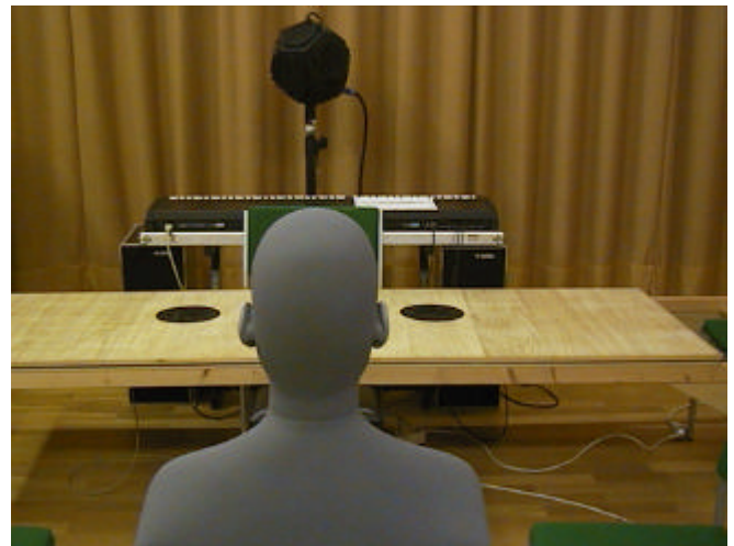
Abbildung 1: Anordnung der BiegeWellenwandler zur Simulation der Schallabstrahlung eines offenen Flügels.

Ein weiterer wesentlicher Unterschied besteht im Einschwingverhalten: Die vom Hammerkopf angeschlagene Klaviersaite erhält ihre gesamte Schwingungsenergie während der Kontaktzeit, daher beginnt die Saitenschwingung stets mit der vollen Amplitude, ein Einschwingvorgang im Instrument kann dagegen lediglich beim Übergang in den Steg erfolgen und zwar dann, wenn die Frequenz der Saite mit der einer Eigenresonanz des Resonanzbodens zusammentrifft. Da die tiefsten beiden Resonanzen bei einem 2 m-Flügel bei etwa 100 Hz bzw 150 Hz liegen, ist dieser Fall eher die